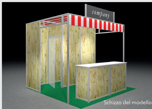
Schizzo del modello