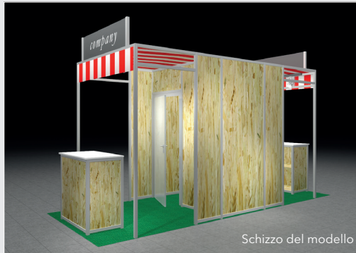
Schizzo del modello

We will plan and organise your trade fair stand and ensure set-up and dismantling are carried out in time. Please order the required stand construction package with the application form.